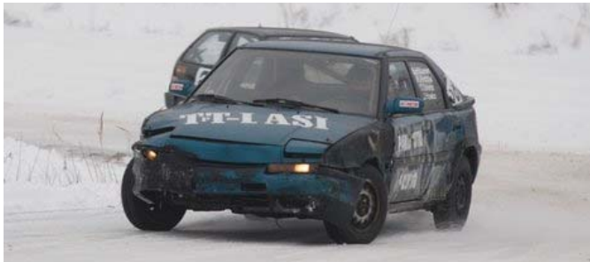
MYYN: Mazda 323F, H: 800 €, sis. vara-auton. Pakoputki Anttila, 040 545 8389.